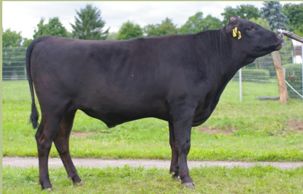
Foto: GWG1028 Kikutsurudoï - Sohn von Kikutsurudoï W628